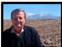
Cónsul honorario de Etiopía